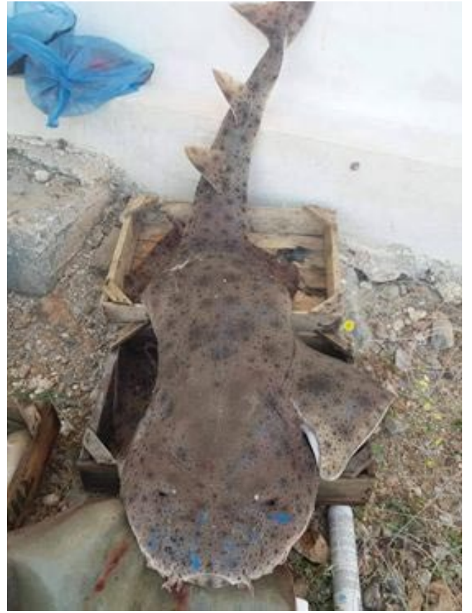
▲ Squatina aculeata - Dedeğaç, Yunanistan