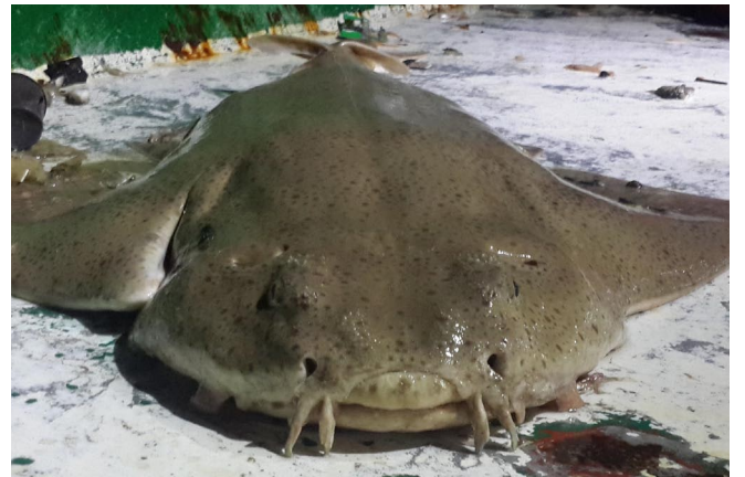
▲ Squatina aculeata - Samandağ, Hatay, Türkiye © Emre Fakioglu