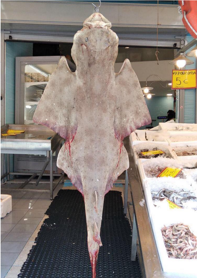
▲ Squatina aculeata - Atina, Yunanistan

Herhangi bir keler türü görüldüğünde, www.angelsarknetwork.com/#map adresindeki Keler Gözlem Haritası'ndan raporlanabilir.